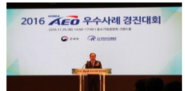
<2016년 경진대회 사진>

-2017년 8월 16일, 출처: 관세청 보도자료- >> READ MORE